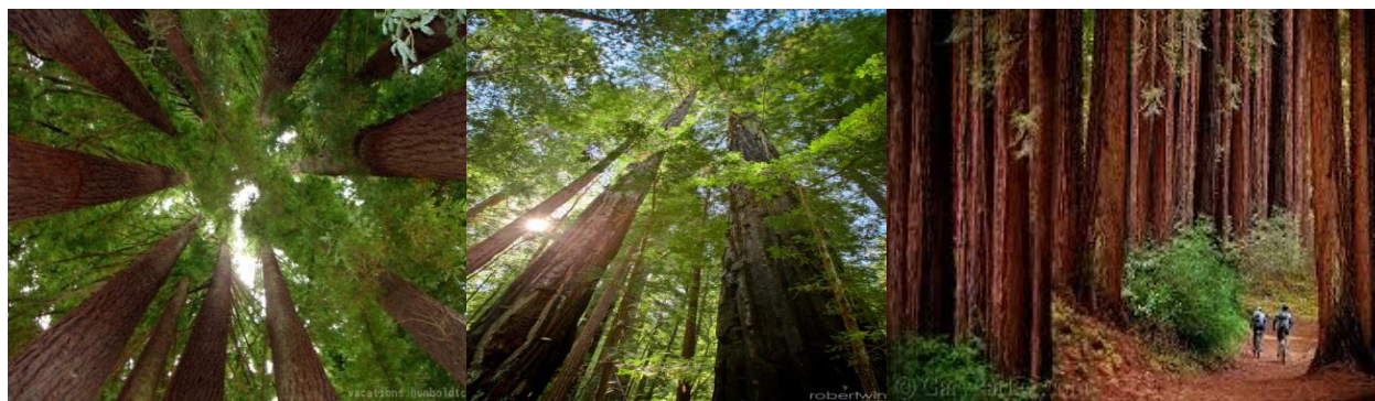
Figura 4 Sequoia National Park.