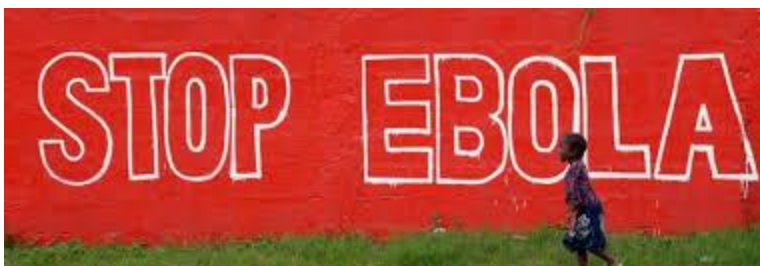
Figura 3 Ebola is real

Fuente: Imagen tomada de Google images. 2016. Ebola