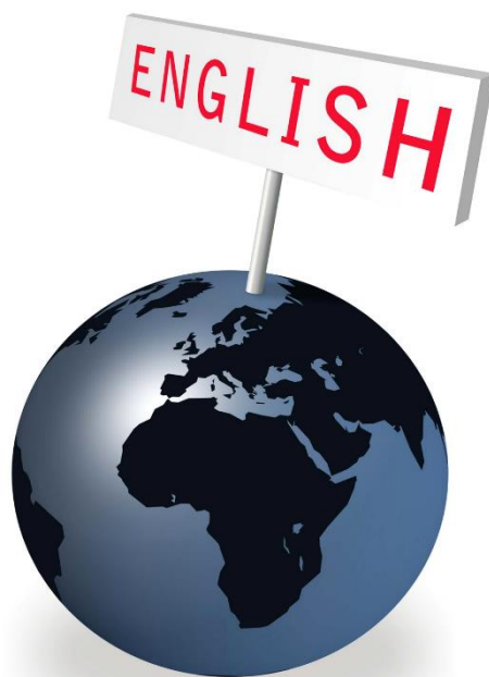
Figura 2 English as an International Language