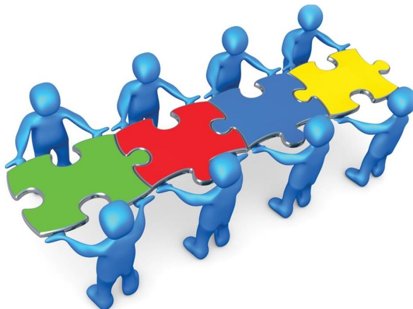
Figura 1 Integración grupal